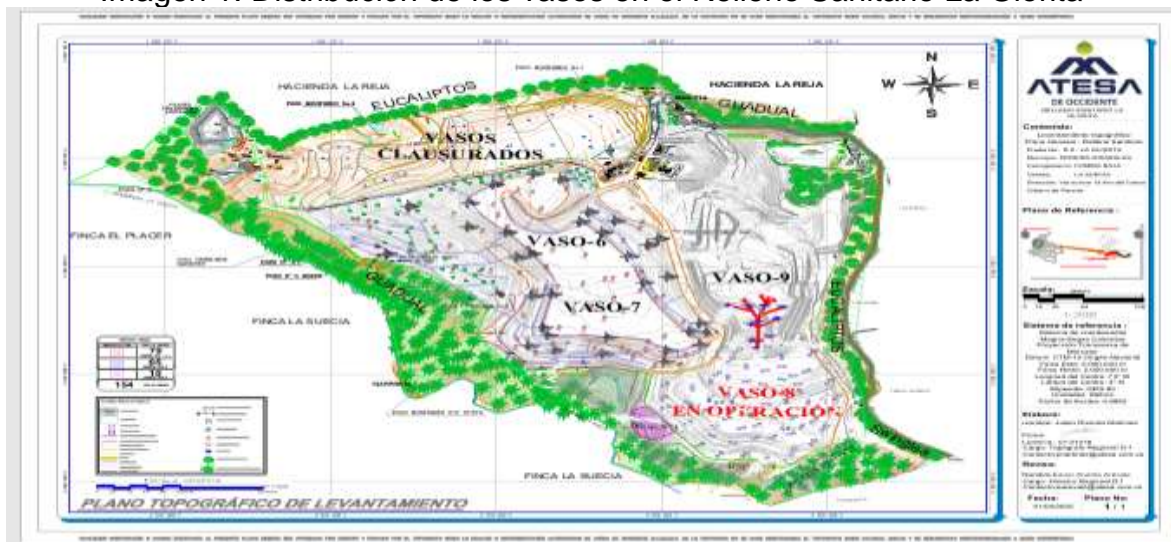
Imagen 1. Distribución de los vasos en el Relleno Sanitario La Glorita